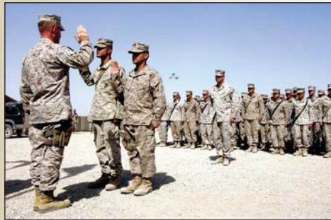
品位と名誉に対する責任を再確認する海兵隊員